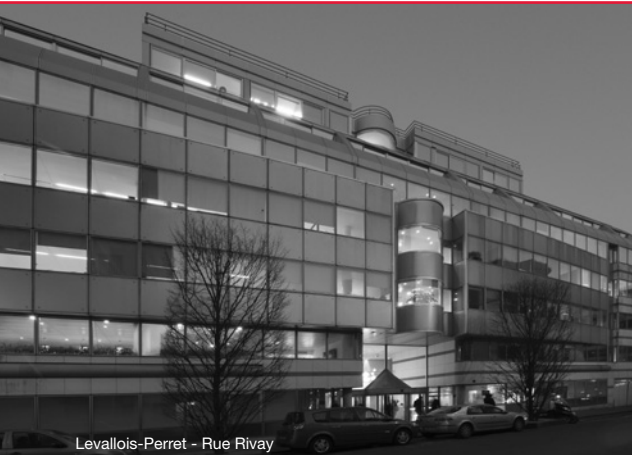
Levallois-Perret - Rue Rivay