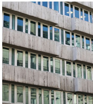
105 rue du Faubourg Saint-Honoré 75008 Paris