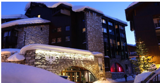
Val d'Isère - L'Aigle des Neiges