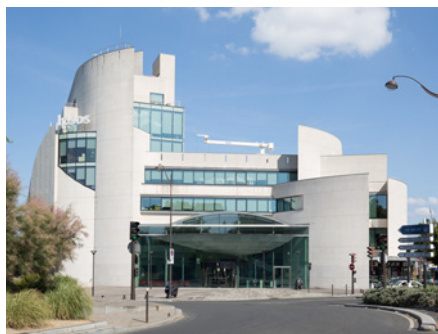
35 Rue de la Marne - 75013 Paris