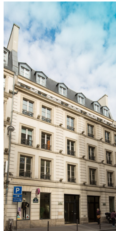
92-94 rue de Provence, 75008 Paris