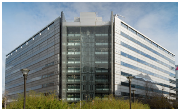
6 place Abel Gance - 92100 Boulogne-Billancourt