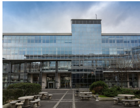
1 rue Giovanni Batista Pirelli 94110 St-Maurice