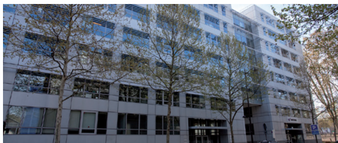
Paris - Pirogues