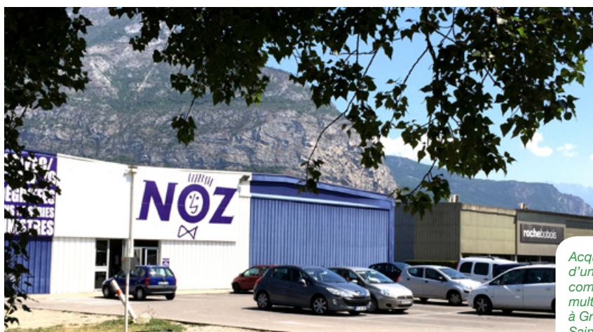
Acquisition d'un bâtiment commercial multilocataires à Grenoble Saint-Egrève

2 736 400 € investis pour des loyers de 230 300 € estimés, soit un rendement immobilier de 8,42%