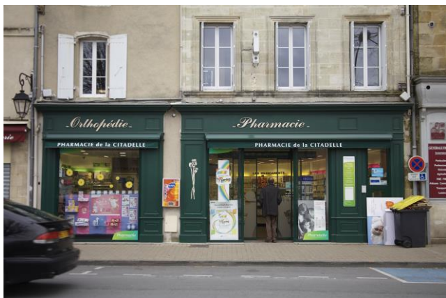
2, cours du Maréchal de Lattre de Tassigny – Blaye (33)

Le taux d'occupation physique moyen du troisième trimestre 2016 des locaux s'établit à 97,37 %. Ce taux est déterminé par le rapport entre la surface totale louée et la surface totale des immeubles si tous étaient loués.