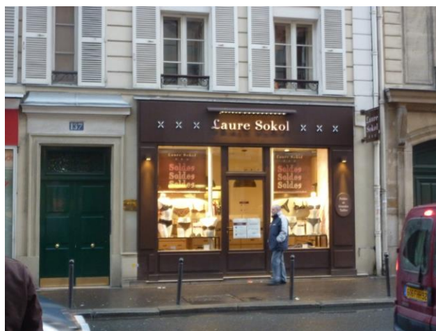
137, rue de Sèvres – Paris (6 ème )