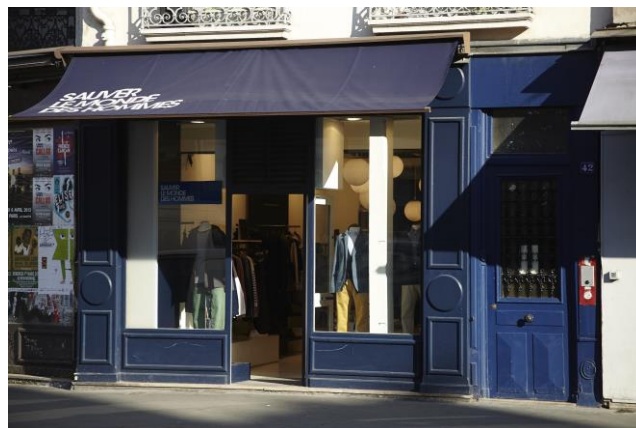
42, rue Saint Antoine – Paris (4 ème )

Montant des loyers (H.T) encaissés au cours du trimestre : 395 317 €