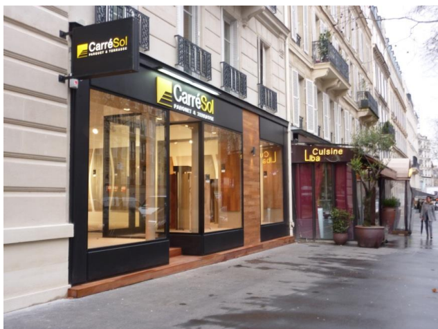
95, avenue de Villiers – Paris (17 ème )

Conformément à la douzième résolution de l'Assemblée Générale du 2 juin 2016, le montant total des dettes financières pouvant être contracté par votre SCPI est plafonné à 7 M€.