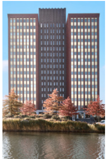
Fascinatio Boulevard 350 - ROTTERDAM (PAYS-BAS)