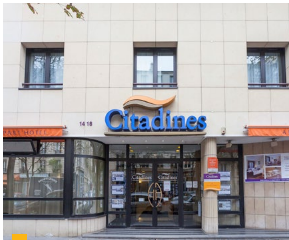
14-18, rue de Chaligny à Paris 12 ème