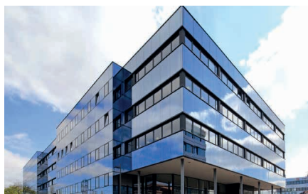
CERGY-PONTOISE (95), rue des Chauffours

Votre SCPI a acquis 1 immeuble ce trimestre.