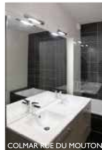
COLMAR RUE DU MOUTON