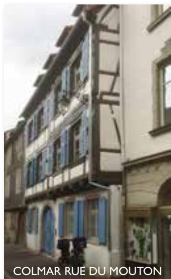
COLMAR RUE DU MOUTON