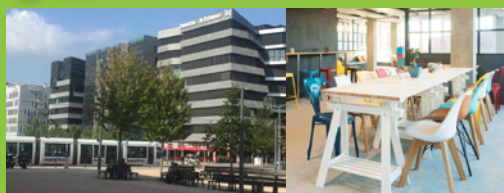
ROKORIKO - Lyon Confluence