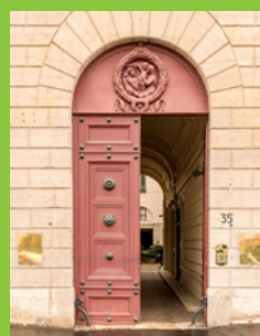
Lyon, place Bellecour