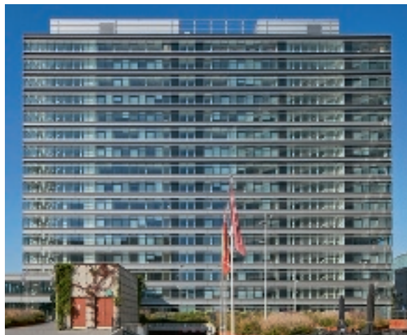
Prinses Beatrixlaan 5-7 - la Haye (Pays-Bas)