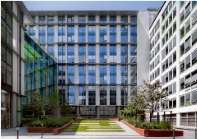
2- 8 rue Ancelle - 92200 Neuilly-sur-Seine