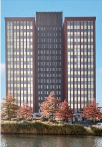
Fascinatio boulevard 350 - Rotterdam (Pays-Bas)