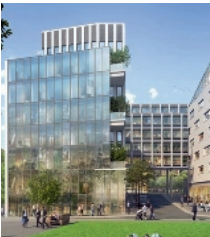
ZAC Porte Poucher - 75017 Paris (VEFA)