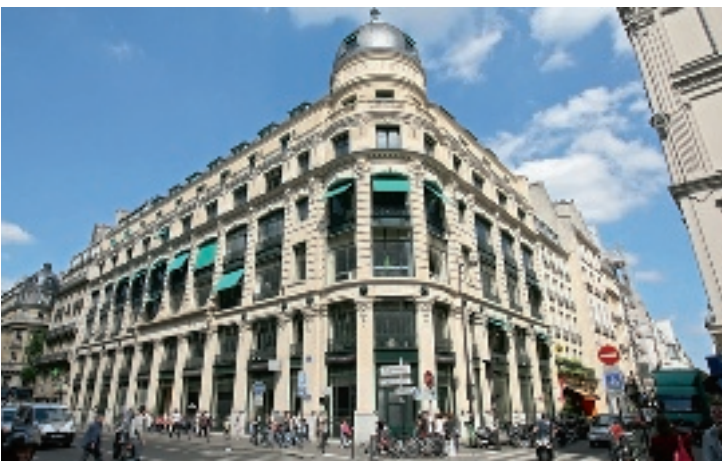
34 rue du Louvre - 75001 Paris