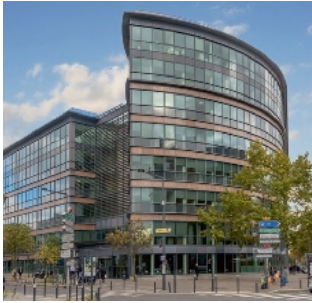
266 avenue du Président Wilson - 93210 Saint-Denis