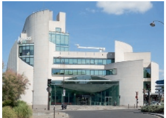
35 rue du Val de Marne - 75013 Paris