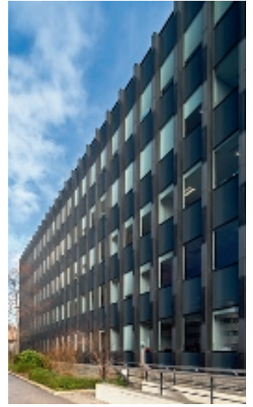
20 rue Hector Malot - 75012 Paris