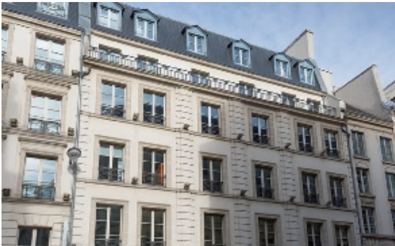
94 rue de Provence - 75009 Paris