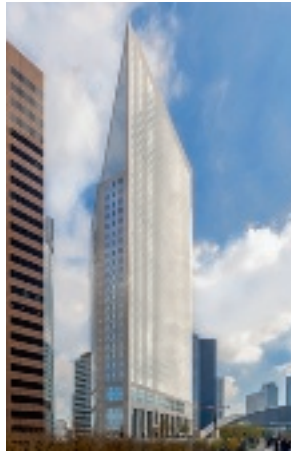
Tour Egée - 9-11 allée de l'Arche 92400 Courbevoie