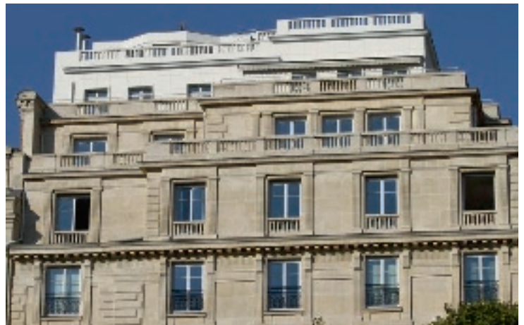
136 avenue des Champs Elysées - 75008 Paris