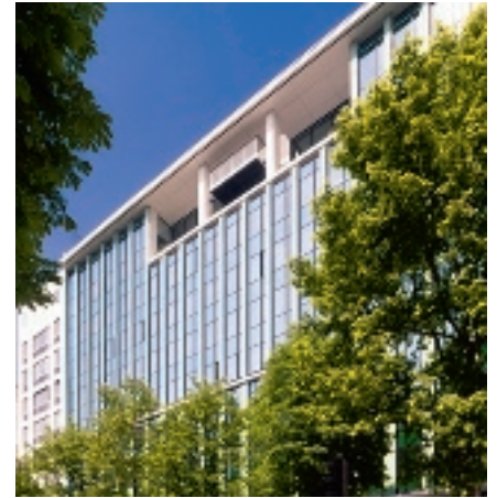
Horizons 17-140 boulevard Malesherbes 75017 Paris