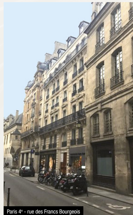
Paris 4 e - rue des Francs Bourgeois

D'autres acquisitions sont actuellement à l'étude.