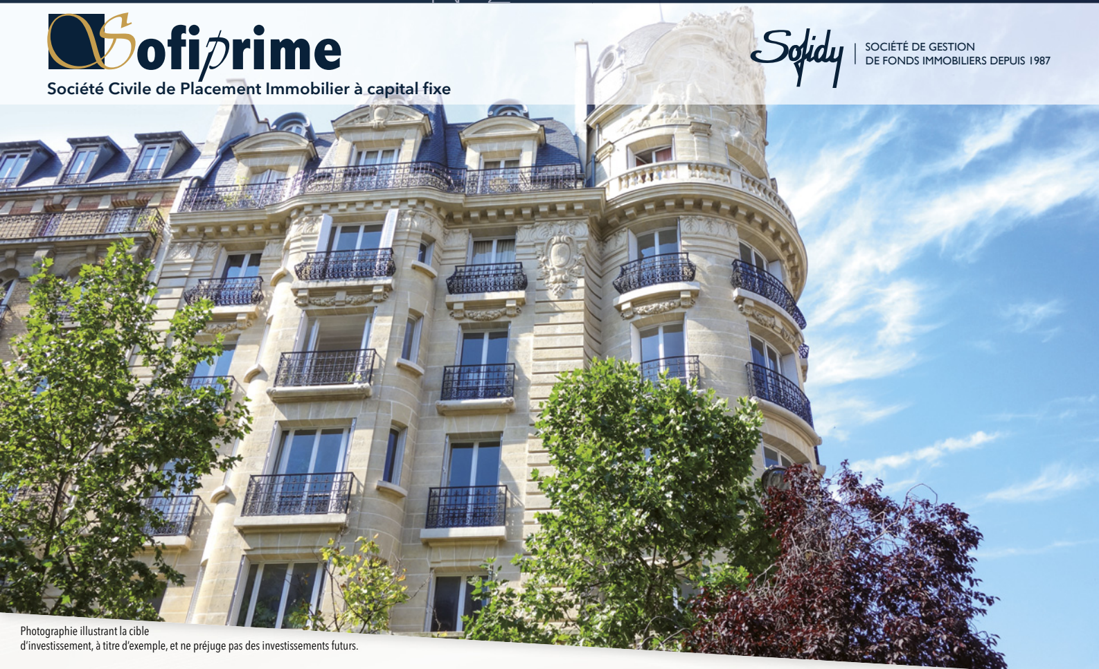
Photographie illustrant la cible d'investissement, à titre d'exemple, et ne préjuge pas des investissements futurs.