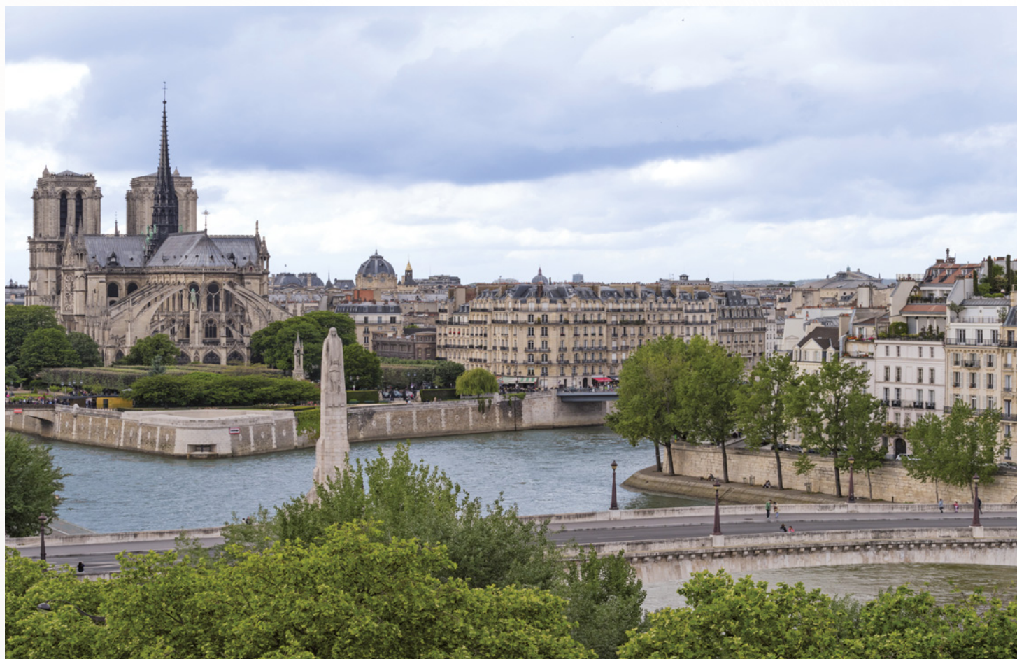
Photographie illustrant la cible d'investissement, à titre d'exemple, et ne préjuge pas des investissements futurs.