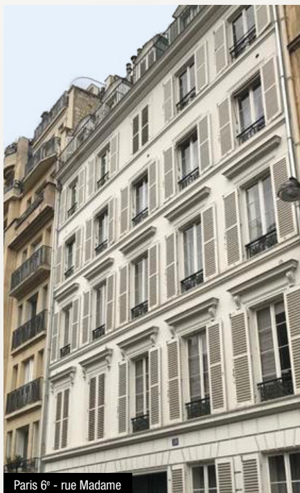
Paris 6 e - rue Madame