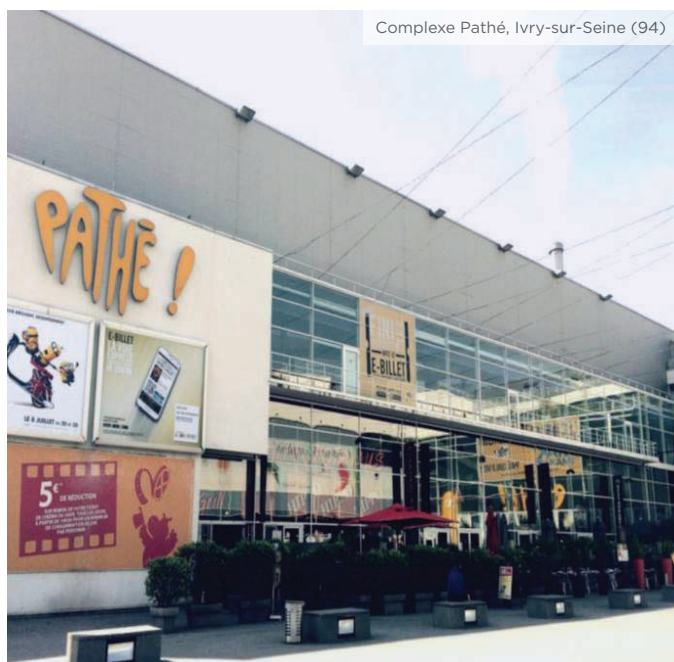
Complexe Pathé, Ivry-sur-Seine (94)