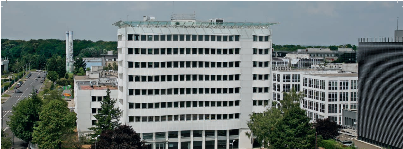
11, avenue Morane Saulnier - Vélizy (78)