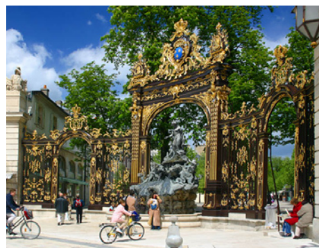
Nancy, un grand pôle séduisant et attractif

Rejoignez-nous autour du concept « COLLECTER, INVESTIR et GÉRER au cœur des territoires ».