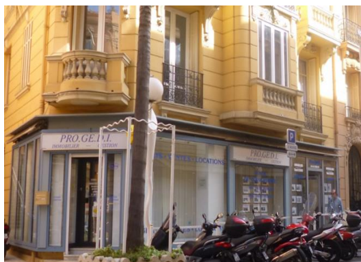
19 bis boulevard de la République – BEAUSOLEIL (06)

Conformément à la 6 e résolution de l'Assemblée Générale du 21 mai 2014, le montant total des dettes financières pouvant être contracté par votre SCPI est plafonné à 40 M€.