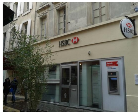
29 rue Georges Clémenceau – CARCASSONNE (11)