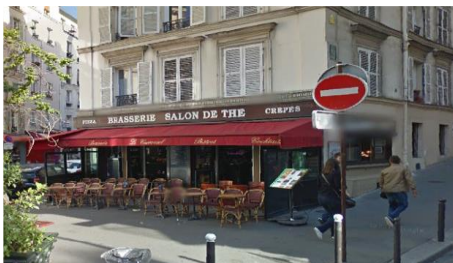
8 rue des trois frères - PARIS (18 ème )