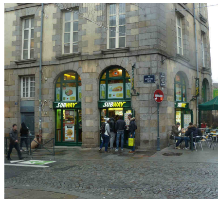
1 place Saint Anne RENNES (35)