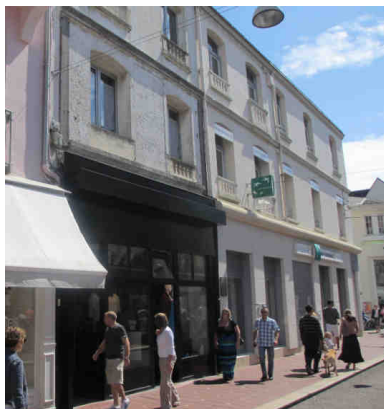
37 rue Saint Jean LE TOUQUET (62)