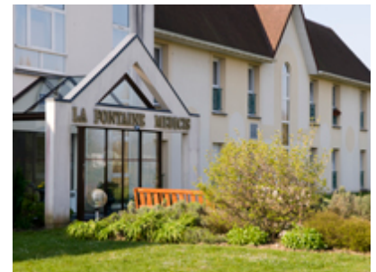
Fontaine Médicis CUCQ (61)

Au cours de ce quatrième trimestre, deux logements ont été acquis dans un EHPAD à CUCQ (62) dénommé FONTAINE MEDICIS. Cette maison de retraite propose de beaux espaces de vie clairs et spacieux, et bénéficie d'un service de qualité. Le lieu est accueillant à proximité de la forêt et de la plage du Touquet.