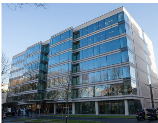
Neuilly sur Seine