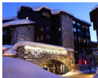
Val d'Isère - L'Aigle des Neiges