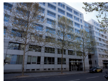
Paris - Pirogues