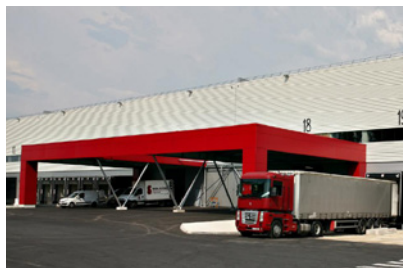
Chatres - Zac Val de Bréon - Bât. 3