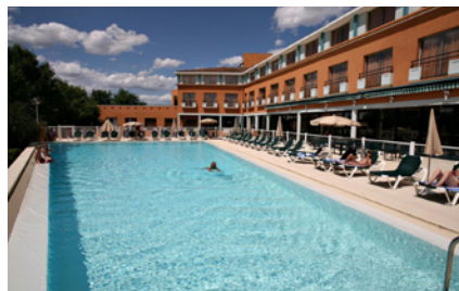
Seilh - Hôtel Golf Mercure