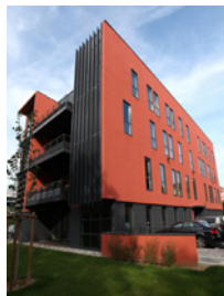
Caluire & Cuire - Cité Park