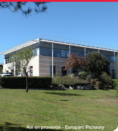
Aix en provence - Europarc Pichaury