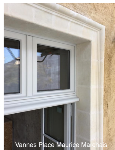
Vannes Place Maurice Marchais

(2) Taux d'occupation financier : Ce taux prend en compte les flux effectivement appelés au titre du trimestre civil écoulé. Il s'agit des loyers, indemnités d'occupation ainsi que des indemnités compensatrices de loyers portant sur les immeubles livrés (à l'exclusion des revenus «non récurrents»), et appelés au titre de la période et divisés par le montant des loyers théoriques.