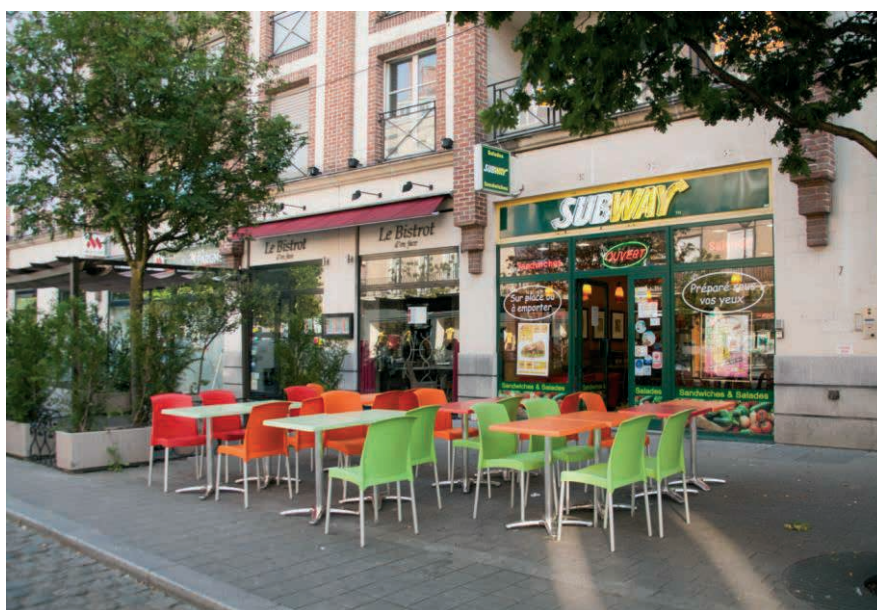
5 bis avenue d'Amsterdam – Valenciennes (59)