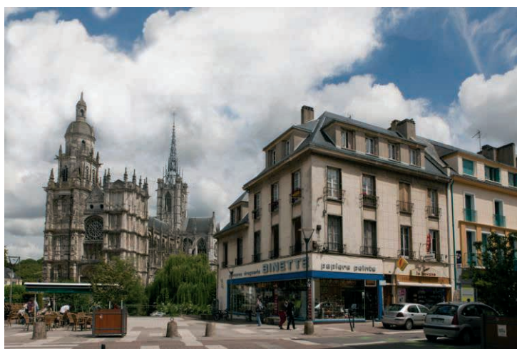
13 rue de la Harpe – Evreux (27)

Conformément à la loi LME d'août 2008, la Société de Gestion précise que le délai de règlement des factures fournisseurs non réglées à la date du 31 décembre 2013 est de 30 jours à date de facture.