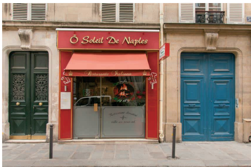
56 rue de Babylone– Paris (7 ème )