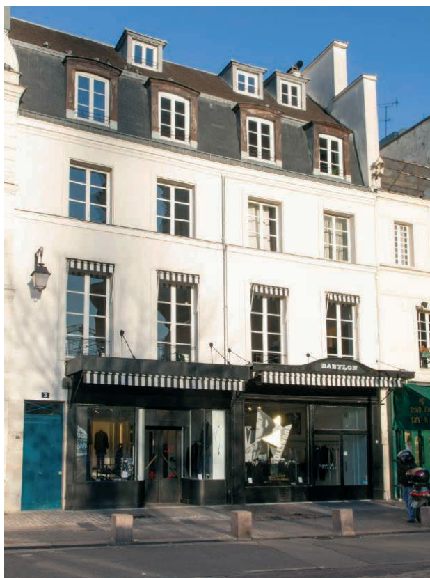
3 rue du Jour – Paris (1 er )

Enfin, à la date de rédaction du présent rapport, nous attirons l'attention des associés sur le projet de loi « Pinel » relatif à l'artisanat, au commerce et aux très petites entreprises. Ce projet de loi, dans sa forme actuelle vise notamment à identifier certains impôts et charges qui pourraient être plus difficilement portés à la charge des locataires. Votre Société de Gestion et l'ASPIM s'emploient à intervenir dans les débats et à limiter les impacts de ce texte s'il venait à être promulgué.