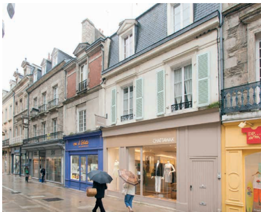
29/31 rue aux Sieurs – Alençon (61)

Le tableau ci-dessus est établi conformément à l'instruction COB du 4 mai 2002 prise en application du règlement N°2001-06. La ligne « Sommes restant à investir » ne reflète cependant pas le niveau de trésorerie disponible de la SCPI au 31 décembre dans la mesure où les flux de trésorerie liés à son activité courante (produits encaissés, charges décaissées, dividendes versés, mouvements sur les dépôts de garantie...) ne sont pas pris en compte.