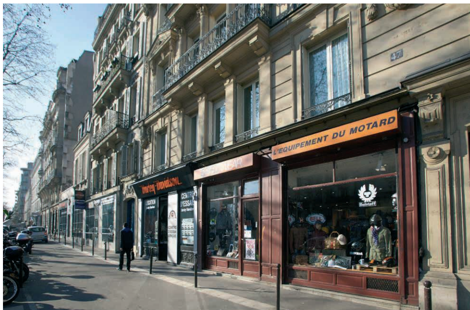
47 boulevard Beaumarchais – Paris (3 ème )

En conséquence, votre SCPI a l'obligation de modifier ses statuts pour les rendre conformes à ces mesures.