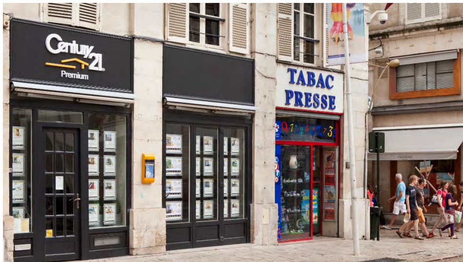
28 rue Jeanne d'Arc à Orléans (45)

L'année 2014 a également été celle de la mise en conformité de votre SCPI avec la directive AIFM, qui prévoit notamment l'obligation de se doter d'un dépositaire. A ce titre, l'Assemblée Générale Mixte du 11 mars 2014 a approuvé une série de modifications statutaires et a ratifié la nomination de CACEIS BANK FRANCE en qualité de dépositaire. Ces mesures, ainsi que l'agrément de SOFIDY en qualité de Société de Gestion conforme à la directive AIFM obtenu le 18 juillet 2014, ont permis une mise en conformité de votre SCPI avant la date limite du 22 juillet 2014.