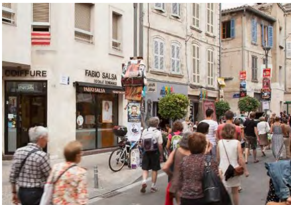
Boutique « Fabio Salsa » 28 place des Corps Saints à Avignon (84)

Le pourcentage des charges par rapport aux recettes locatives intègre les charges financières liées aux intérêts d'emprunts qui permettent par ailleurs de générer des produits locatifs supplémentaires grâce à l'effet de levier du crédit.