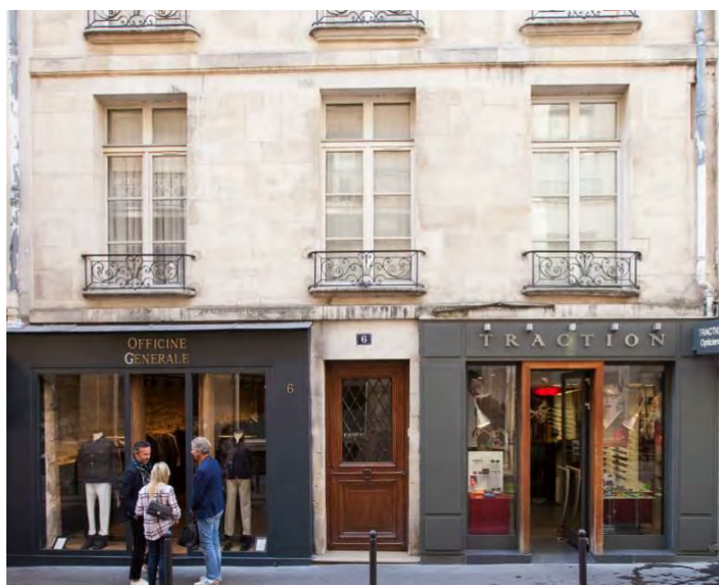
6 rue du Dragon à Paris (6 ème )