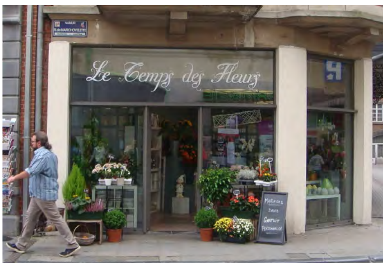
39 rue de Marchovelette à Namur (Belgique)

Concernant les informations comptables et financières de la SCPI, les procédures de contrôle interne des services comptables intègrent notamment la production de prévisions trimestrielles, l'analyse des écarts entre les comptes trimestriels et les prévisions, la mise en œuvre de contrôle de 1 er et 2 nd degrés et la permanence de la piste d'audit.