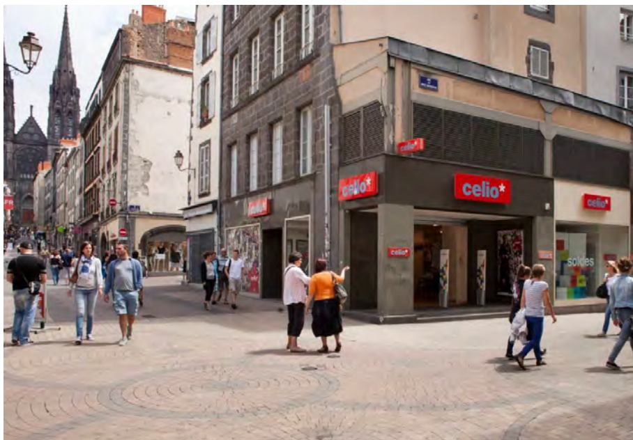
27 rue du Onze Novembre à Clermont Ferrand (63)

La vacance de 6,92 % des loyers facturables correspond à un manque à gagner locatif de 379 890 €.