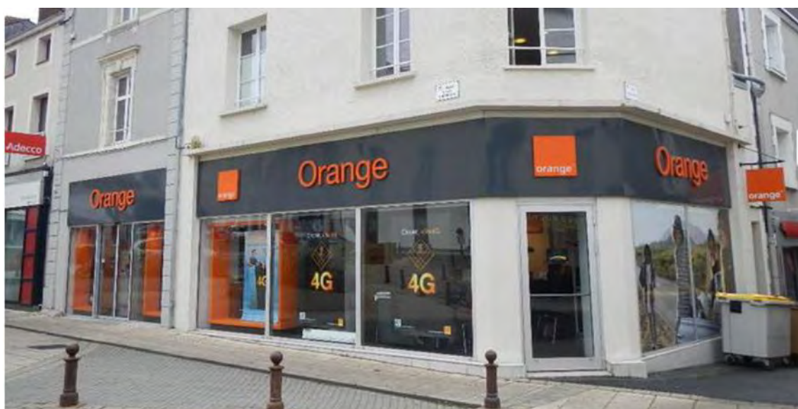
87/89 rue Nationale à Cholet (49)

Les travaux de gestion locative se poursuivent afin de réduire progressivement la vacance, notamment sur l'actif du boulevard des Coquibus à Evry et de continuer à améliorer le taux d'occupation malgré un environnement économique toujours difficile.