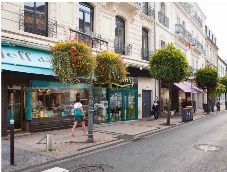
2 rue du Maréchal Foch à Tarbes (65)

L'ensemble des diagnostics et plans d'actions a été piloté de juin 2011 à fin 2012 par un consultant dédié à ces aspects dont sa mission a consisté à mettre en place des outils de pilotage et de reporting ainsi qu'à sensibiliser les équipes et les prestataires aux meilleures pratiques. Ces outils et bonnes pratiques sont désormais intégrés dans les process de gestion immobilière. La gestion de la « performance durable » des actifs immobiliers participe fortement à leur valorisation financière dans le temps.