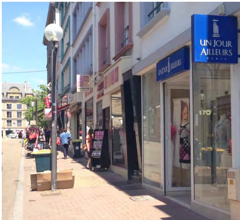
11 rue de l'Assemblée Nationale à Lorient (56)