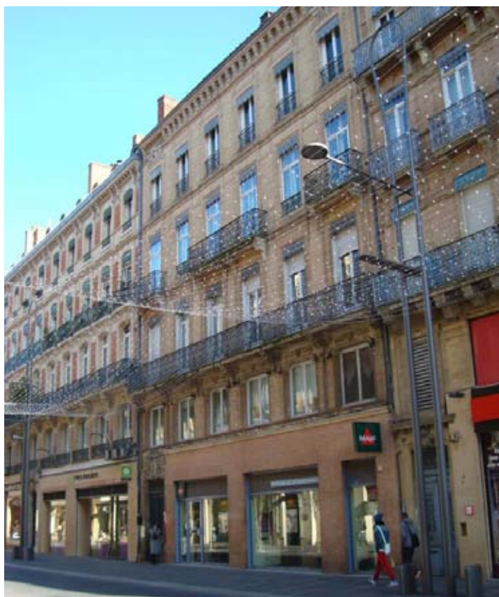
Agence « MAIF » à Toulouse (31) – rue d'Alsace Lorraine

Au 31 décembre 2013, en dehors des procédures normales engagées à l'encontre des locataires en retard dans le paiement de leur loyer, aucun risque identifié n'a fait l'objet de provision.