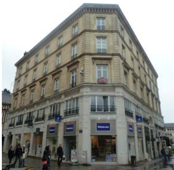
« Micromania » à Rouen (76) - rue du Gros Horloge

La liste exhaustive des acquisitions depuis le lancement de la SCPI figure dans le tableau du patrimoine page 29.