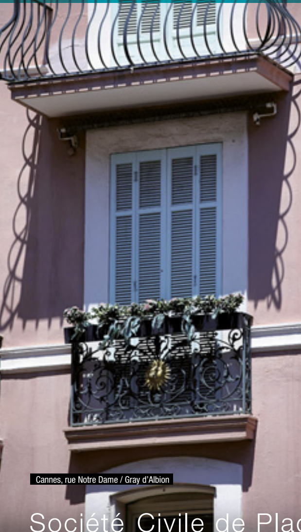
Cannes, rue Notre Dame / Gray d'Albion