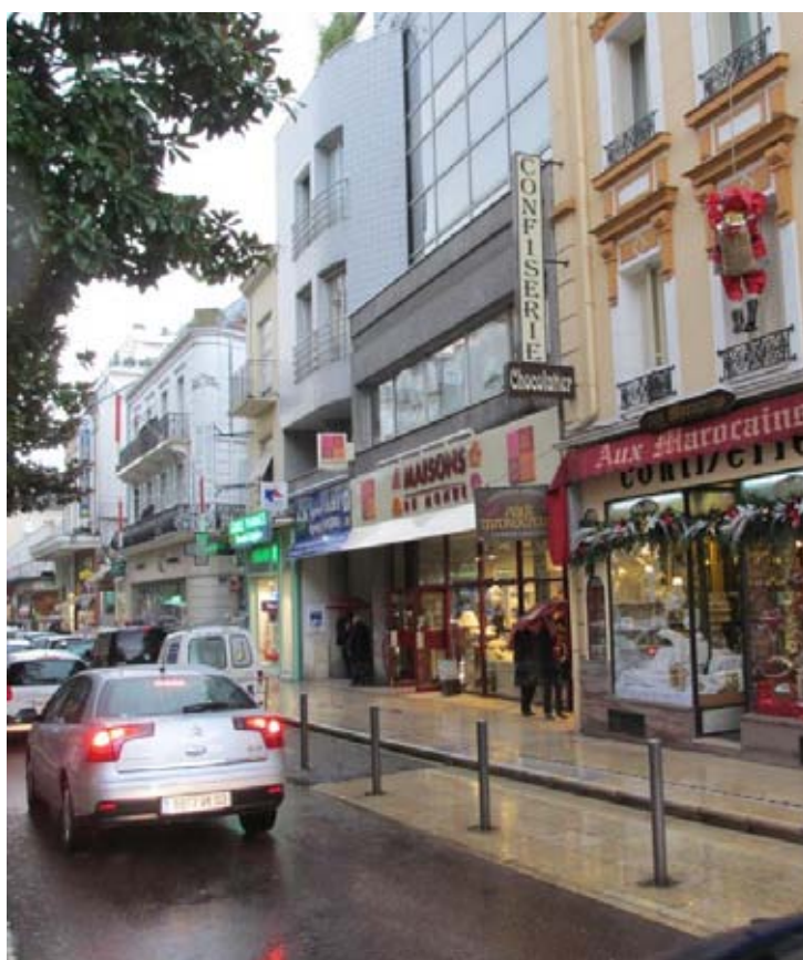
« Maisons du Monde » à Vichy (03) – rue Georges Clémenceau

Le tableau ci-dessus est établi conformément à l'instruction AMF du 4 mai 2002 prise en application du règlement N°2001-06. La ligne « Sommes restant à investir » ne reflète cependant pas le niveau de trésorerie disponible de la SCPI au 31 décembre dans la mesure où les flux de trésorerie liés à son activité courante (produits encaissés, charges décaissées, dividendes versés, mouvements sur les dépôts de garantie...) ne sont pas pris en compte.