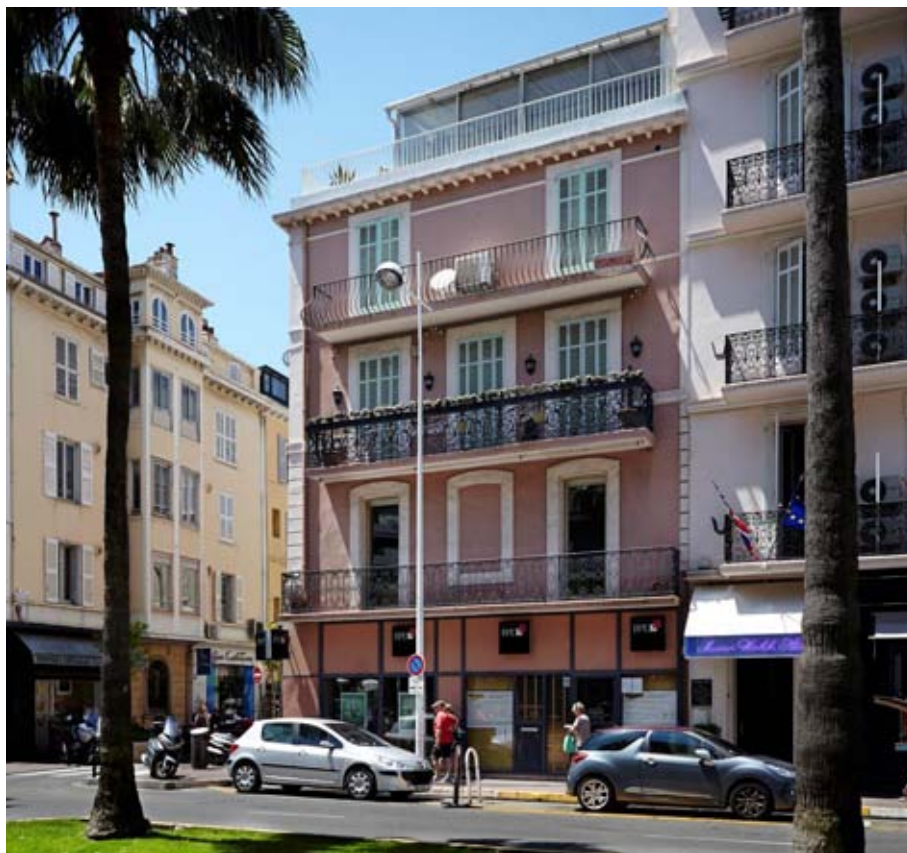
Agence « BPE » à Cannes (06) – rue Notre Dame

Compte tenu de l'absence de travaux identifiés sur les immeubles détenus par IMMORENTE 2, le patrimoine ayant été acquis très récemment, l'anticipation des travaux de grosses réparations des exercices à venir est basée sur une approche statistique.