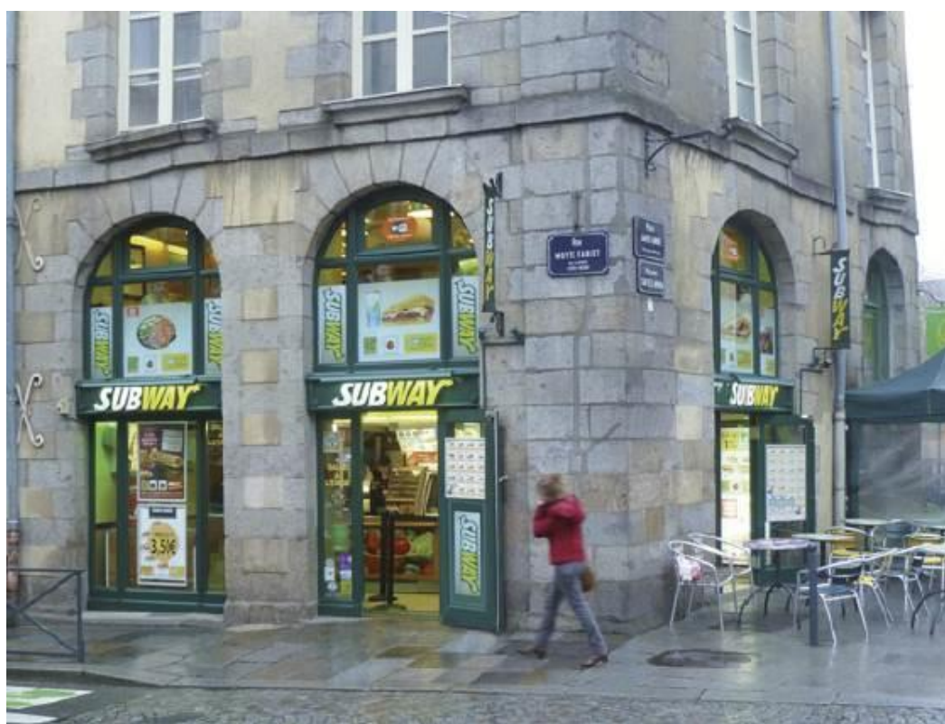
« Subway » à Rennes (35) – place Sainte Anne

A la date de rédaction du présent rapport, nous attirons l'attention des associés sur le projet de loi « Pinel » relatif à l'artisanat, au commerce et aux très petites entreprises. Ce projet de loi, dans sa forme actuelle vise notamment à identifier certains impôts et charges qui pourraient être plus difficilement portés à la charge des locataires. Votre Société de Gestion et l'ASPIM s'emploient à intervenir dans les débats et à alimenter les impacts de ce texte s'il venait à être promulgué.