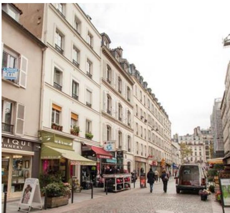
Boutique de Maroquinerie à Paris (7 ème ) – rue Cler