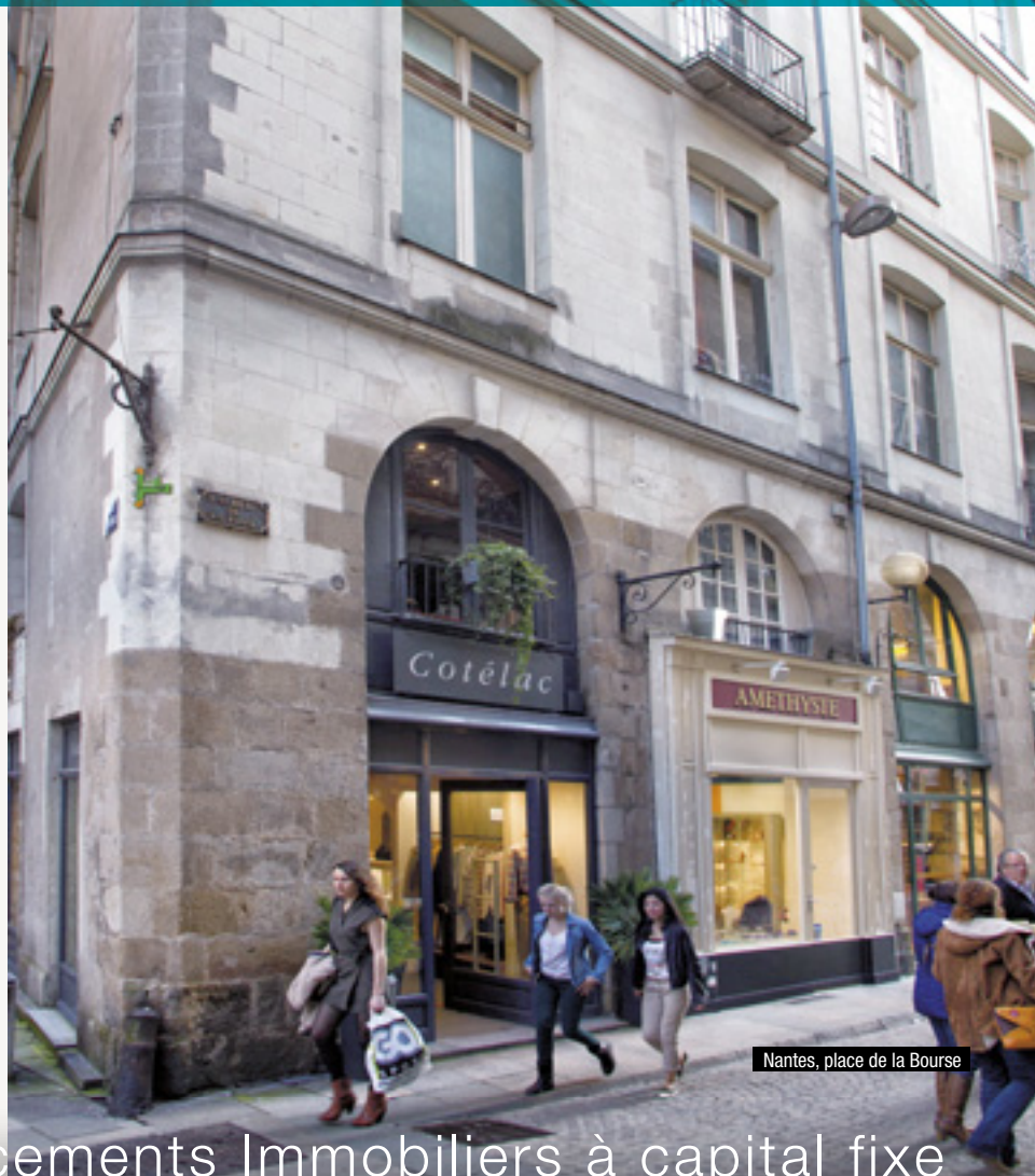
Nantes, place de la Bourse

Société Civile de Placements Immobiliers à capital fixe