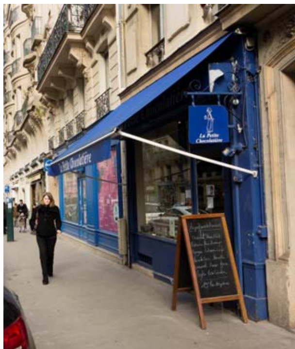
« La petite chocolatière » à Paris (5 ème ) - rue Gay Lussac

(1) dividende brut avant prélèvement libératoire versé au titre de l'année N rapporté au prix de part acquéreur moyen de l'année N.