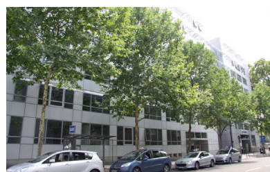
9/35 Avenue Pierre de Coubertin, 75013 Paris