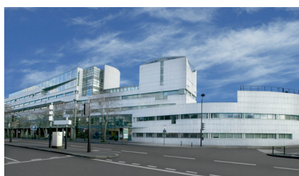
12, Rue des Pirogues, 75012 Paris