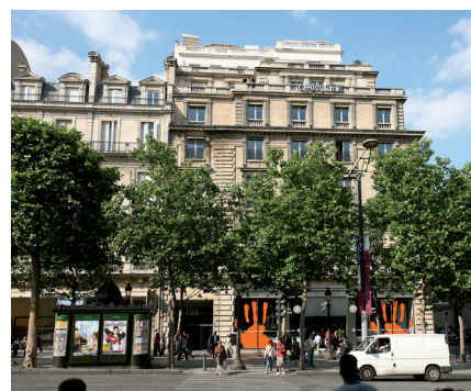
Paris - Avenue des Champs Elysées