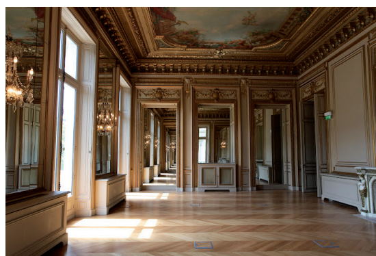
Paris - Avenue des Champs Elysées