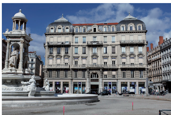
Lyon - Herriot

Aucune cession au cours du 3 e trimestre.