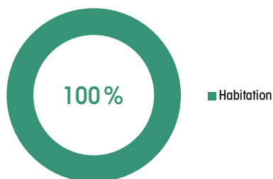
Répartition par nature de locaux du patrimoine en surface au 31 décembre 2017