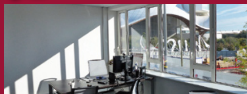
Nouveau quartier de l'Amphithéâtre à Metz

Zoom sur... une diversité d'immeubles de bureaux