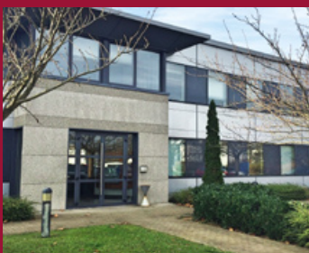
Parc Européen de l'Entreprise à Strasbourg Schiltigheim