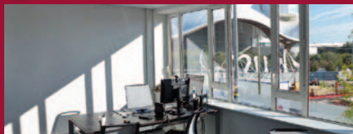
Nouveau quartier de l'Amphithéâtre à Metz

Zoom sur... une diversité d'immeubles de bureaux