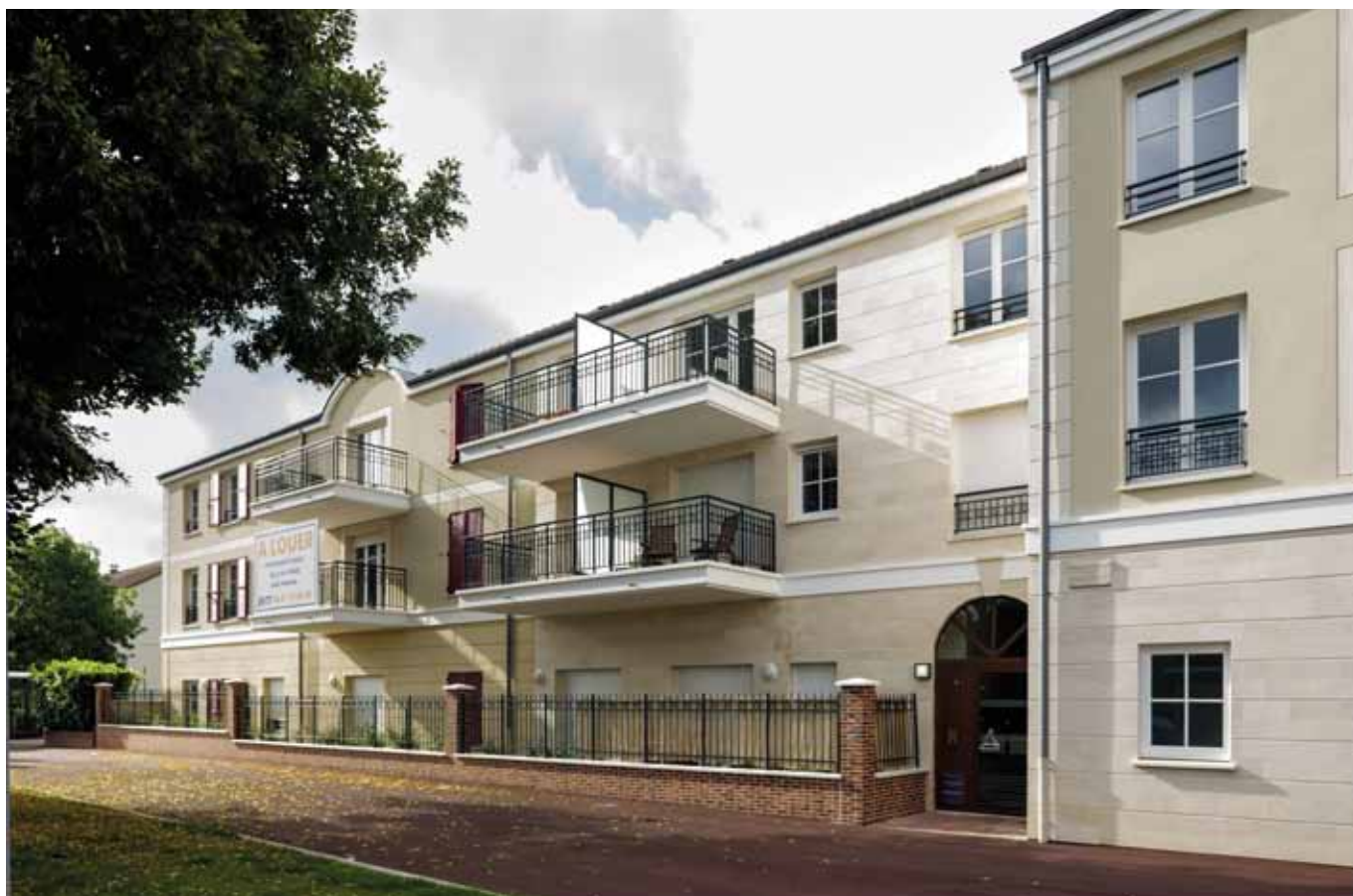
Immeuble du 32-36, rue Hélène Boucher à Voisins le Bretonneux (acquisition de 26 logements + parkings pour Domivalor 4, livrés en avril 2012).

Les loyers nouvellement contractés sont stables ou en recul, malgré une nouvelle augmentation de l'Indice de Référence des loyers (IRL) de 2,15 % sur un an.