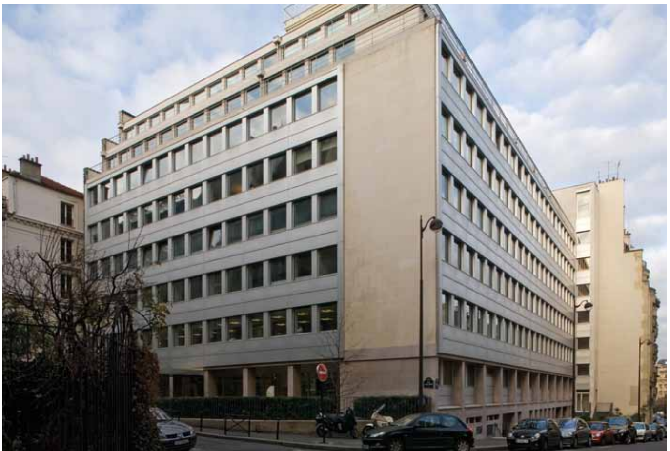
Immeuble de bureaux - 2-4, rue Louis David à Paris 16 ème .

Dans ce contexte où les locataires montrent des exigences accrues, y compris en termes de qualité, les bailleurs se doivent d'être à l'écoute des besoins des entreprises et de faire preuve d'imagination pour éviter des départs ou attirer de nouveaux locataires. Les renégociations de loyers sont d'autant plus sensibles que l'Indice du coût de la construction, référence encore majoritaire, est marqué par une certaine volatilité avec une hausse de + 4,6 % entre le deuxième trimestre 2011 et 2012, suivie d'une baisse de 1,08 % au troisième trimestre 2012 (soit - 4,32 en rythme annuel).