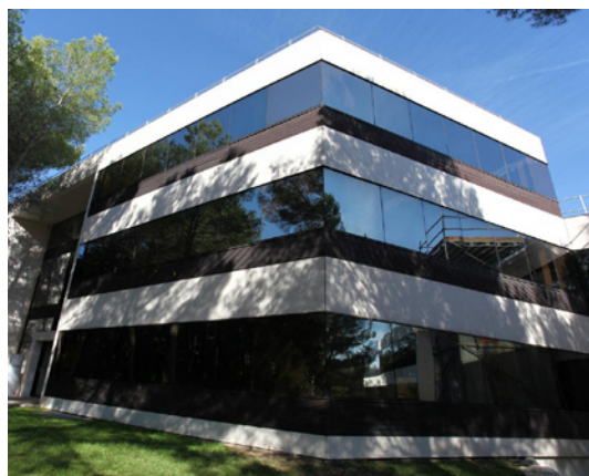
Valbonne - Les Lucioles