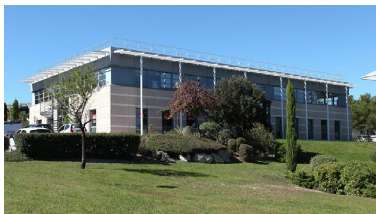
Aix en Provence - Europarc Pichaury