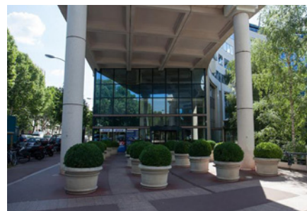
Issy-les-Moulineaux - Le Zeneo