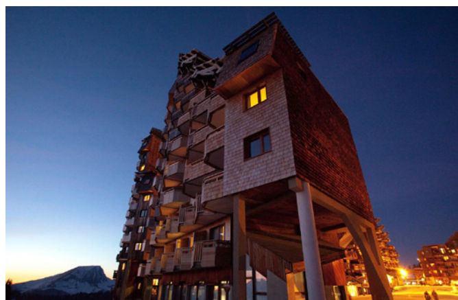
Avoriaz - Hôtel le Saskia