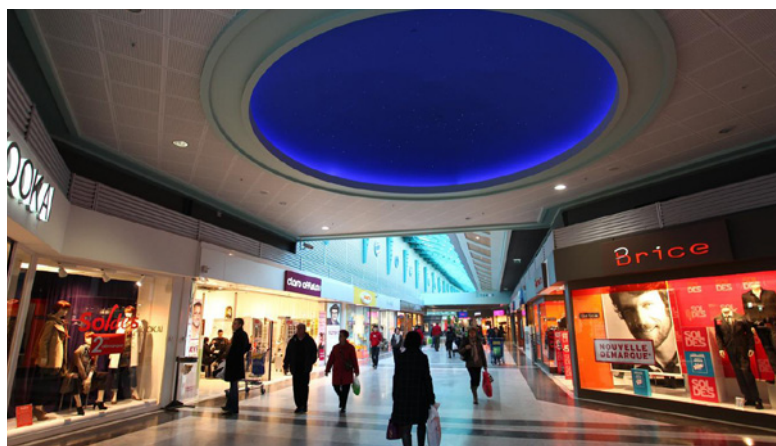
Mérignac - Centre Commercial Mérignac Soleil