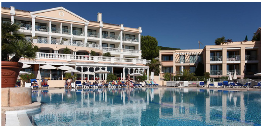
Cannes - Villa Francia