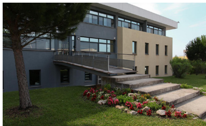
Aix en Provence - Europole