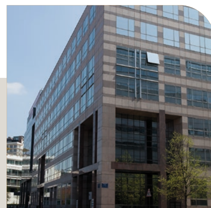
La Mail à Boulogne-Billancourt

Créée en 1991, Multimmobilier 2 est une SCPI d'entreprise dont le parc immobilier est composé de bureaux et de commerces situés principalement à Paris et en région parisienne. Grâce aux nouveaux capitaux collectés, Multimmobilier 2 diversifie chaque année davantage son patrimoine immobilier.