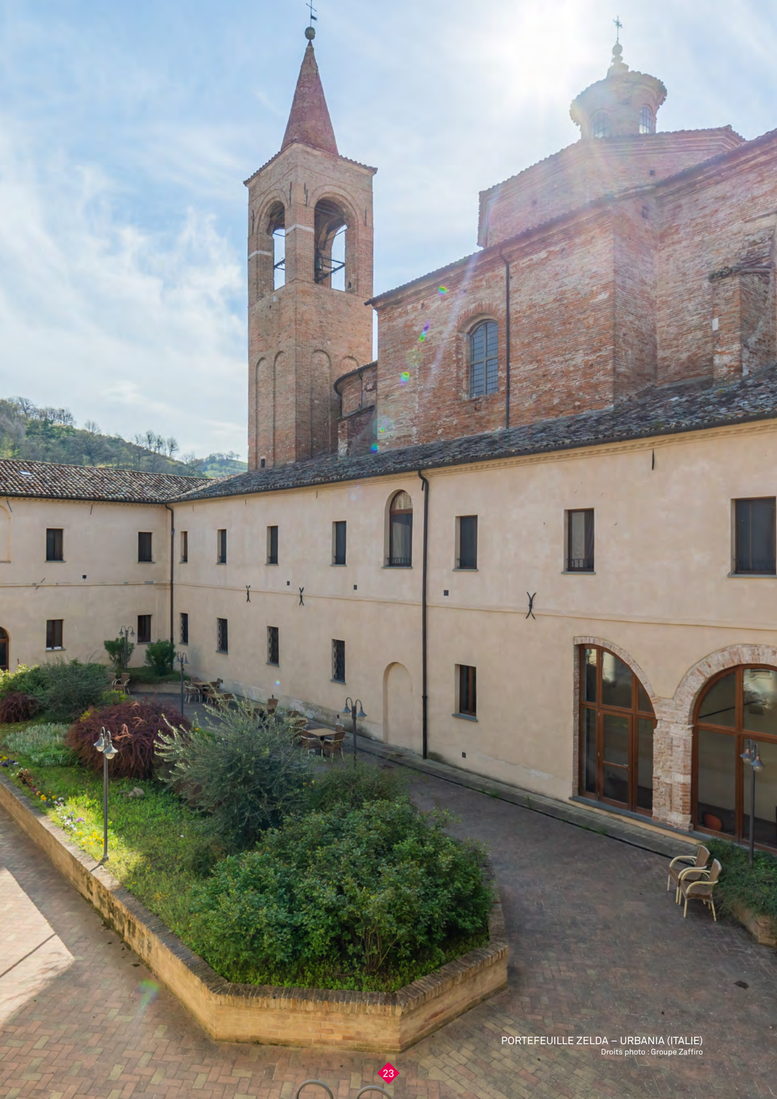
PORTEFEUILLE ZELDA – URBANIA (ITALIE)