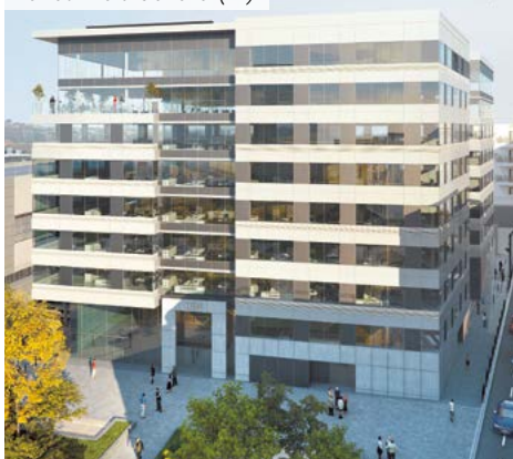
Le Hub – Levallois-Perret (92)

*** Pour les non résidents seuls les immeubles détenus en France sont pris en compte.