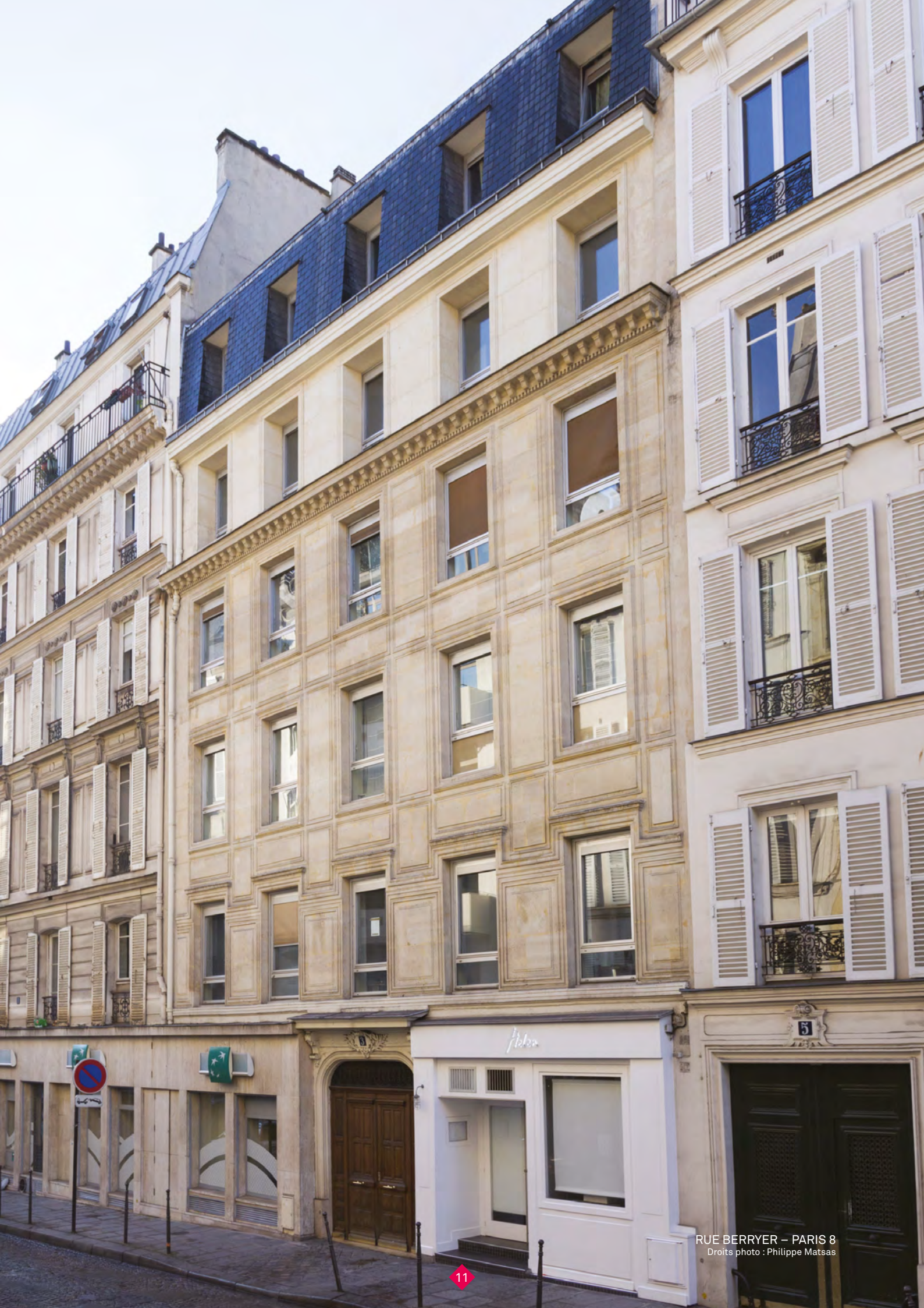
RUE BERRYER – PARIS 8