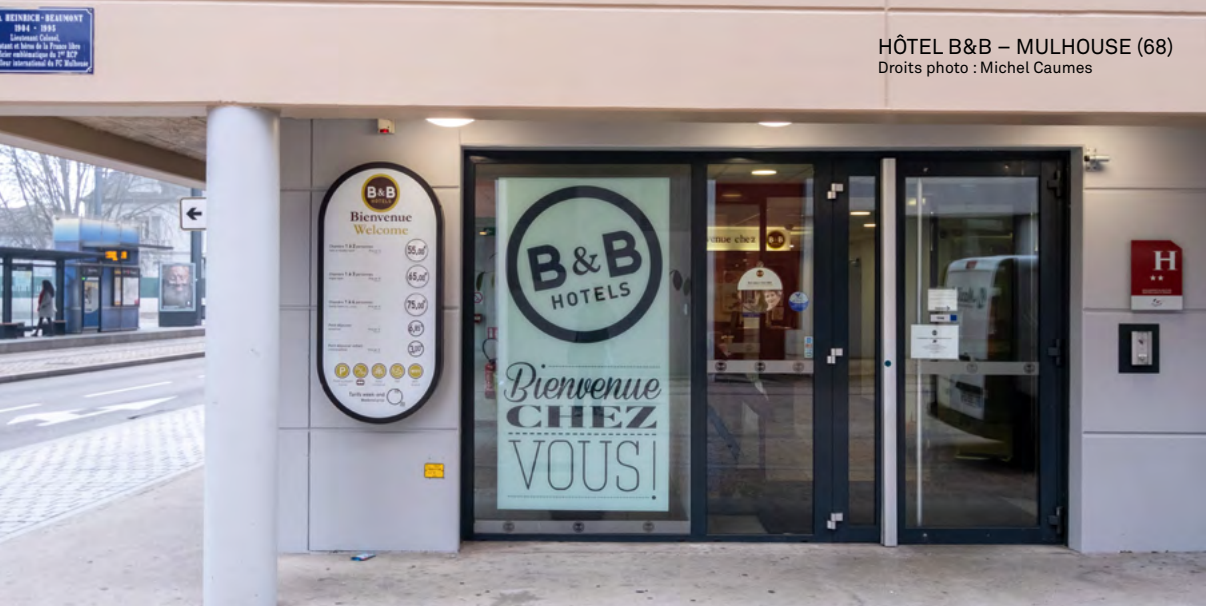
HÔTEL B&B - MULHOUSE (68)