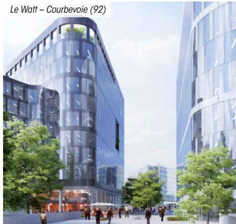
Le Watt – Courbovoie (92)

*** Pour les non résidents seuls les immeubles détenus en France sont pris en compte.