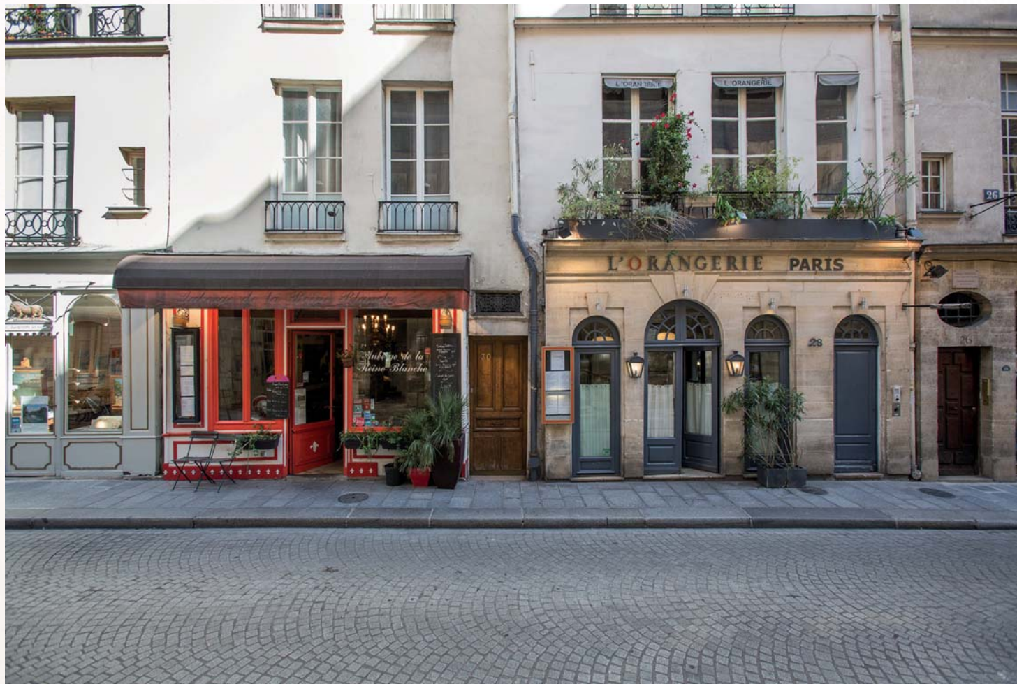
Rue Saint-Louis-en-l'Île - Paris 4 ème

Exemple d'investissement ne préjugant pas des investissements futurs