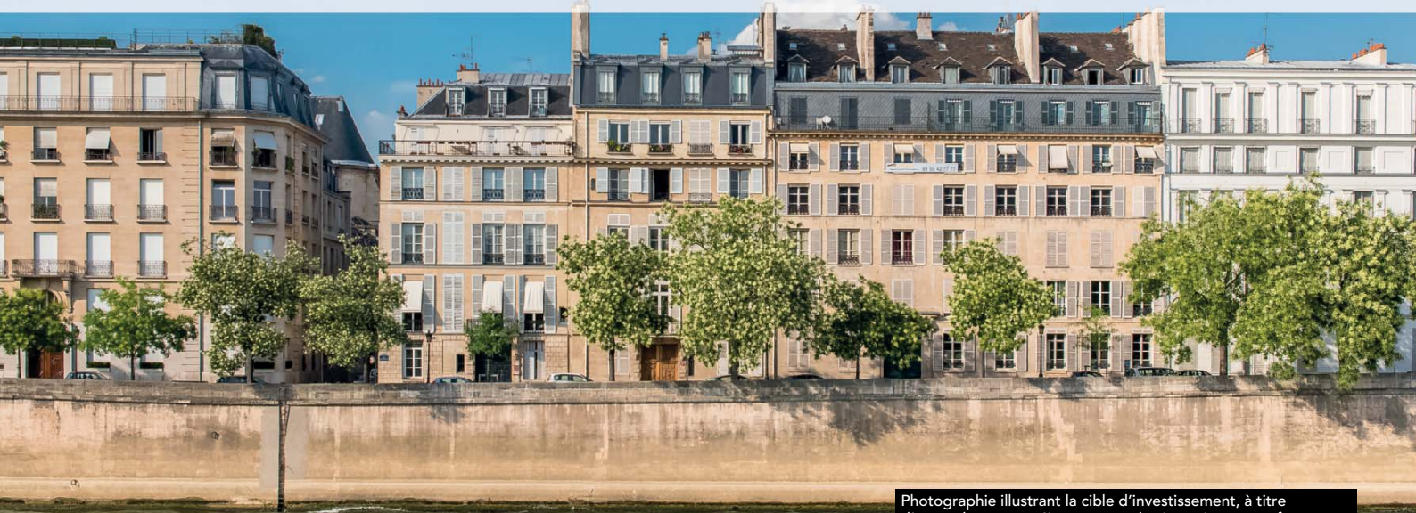
Photographie illustrant la cible d'investissement, à titre d'exemple, et ne préjugant pas des investissements futurs.