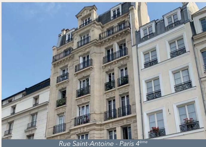
Rue Saint-Antoine - Paris 4 ème

(1) HAB (Habitation); CCV (Commerce de centre-ville)