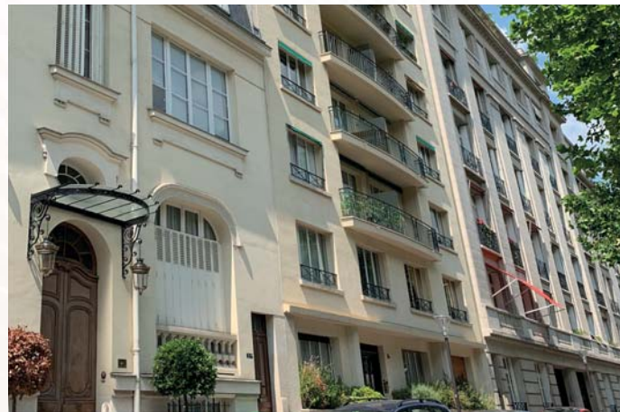
Avenue de Ségur - Paris 7 ème

Exemples d'investissements ne préjugent pas des investissements futurs