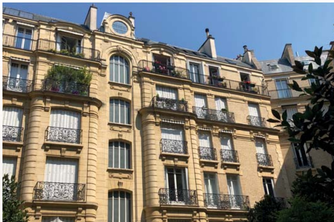
Rue de la Pompe - Paris 16 ème

Sous promesse de vente 0,00 % En travaux 0,00 % En recherche de locataires 0,00 %