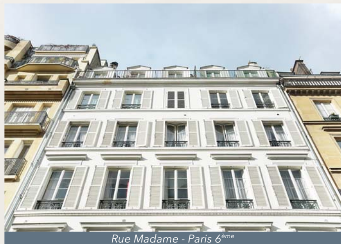
Rue Madame - Paris 6 ème